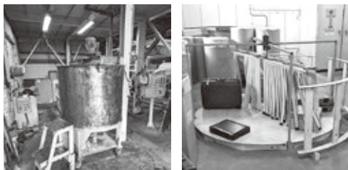
▲エマルジョン化の容器（左）と耐久試験（右）は同社のものづくりを支えている